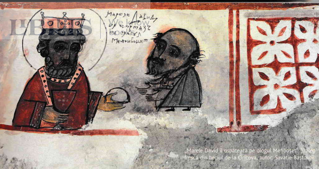
„Marele David îl ospătează pe ologul Mefiboset” (I Regi) frescă din beciul de la Ortova, autor: Savatie Bastovoi

rostită de creștinii ortodocși în rugăciunea de mulțumire după fiecare masă: