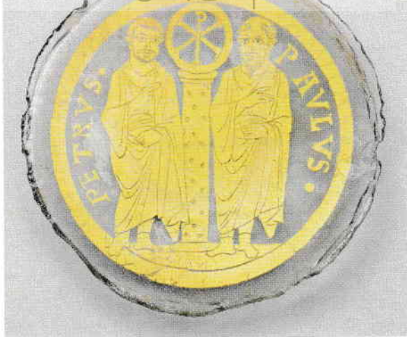
Talger cu Sfinții Petru și Pavel și hristograma lui Hristos (secolul al IV-lea) – The Metropolitan Museum of Art, New York

constă tocmai în faptul că nu există mîncăruri interzise, ci doar recomandări legate de moderație și perioadele în care se folosesc.